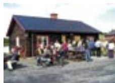
Hamncafé & Vandrarhem.4